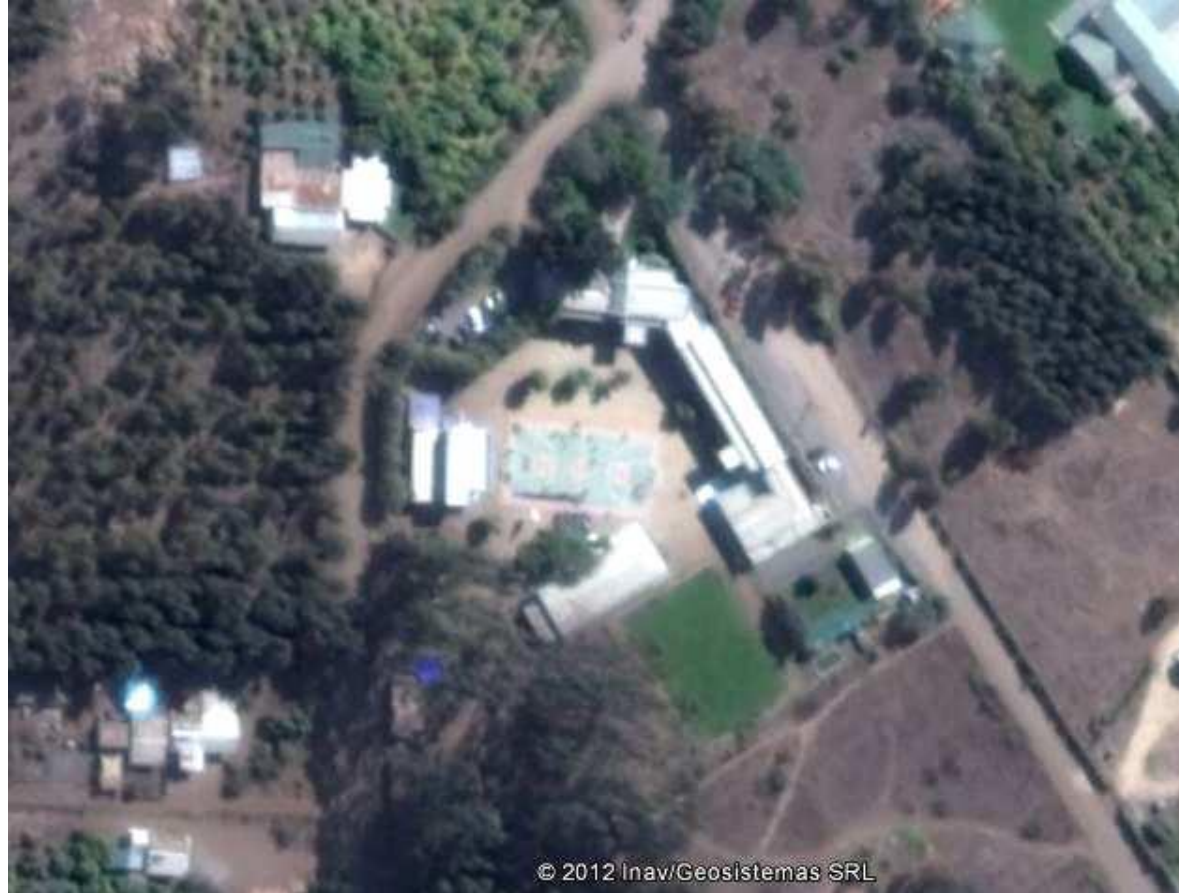
(Vista aérea del establecimiento)